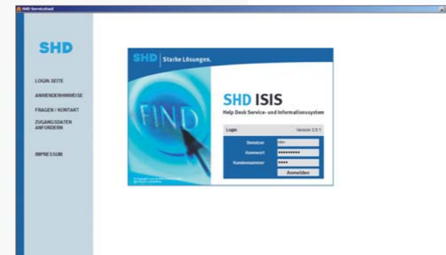
Die Kundennummer und ein persönliches Kennwort machen Ihre Eingaben sicher und schützen vor Missbrauch.

Sie starten das Online-Tool ISIS über die Homepage www.shd.de . Durch Klicken des Buttons Service kommen Sie ins ISIS-Menü. Die Online-Anmeldung im System erfolgt durch die Eingabe der Kundennummer und des persönlichen Kennworts. So ist Missbrauch ausgeschlossen. Zugriffsrechte und Ansichten werden benutzerabhängig gesteuert.